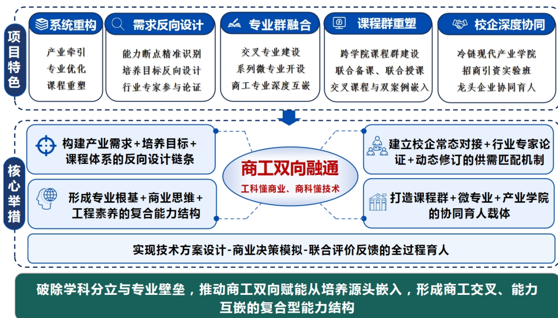
图 2 产业应用牵引下商工双向融通复合型人才培养机制总体架构