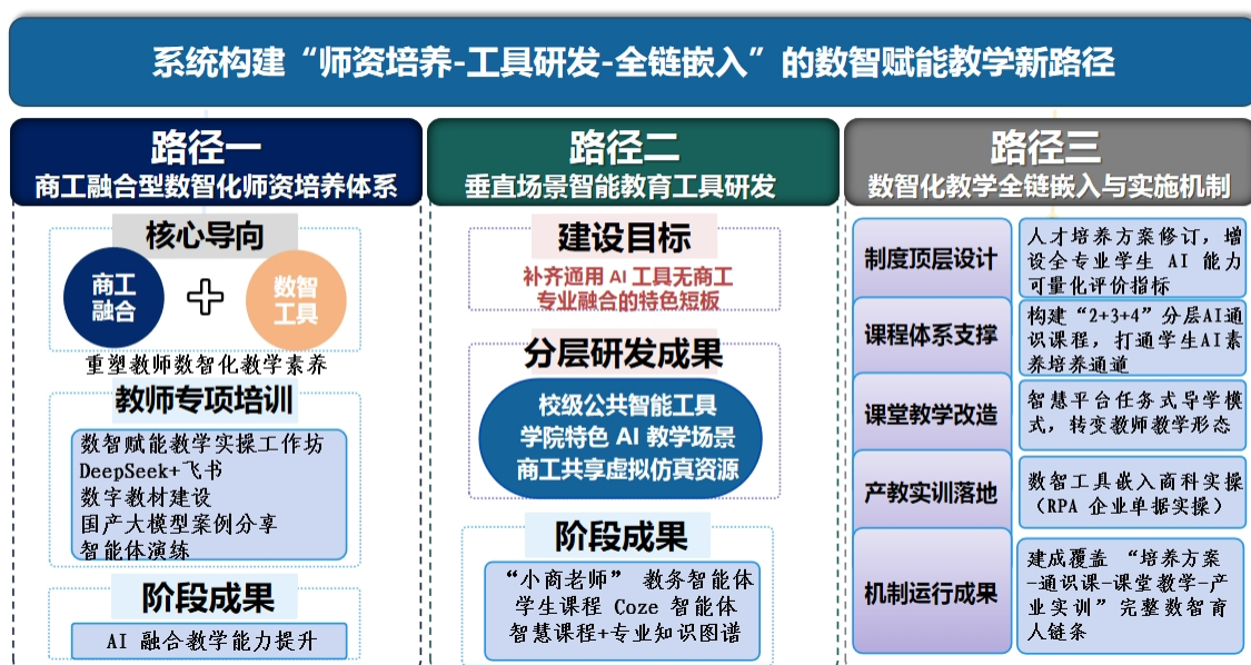
图 4 数智赋能教学实施路径架构

台，将课程拆解为任务点，实现从“教”到“导”的转变。依托实验中心与产教基地，将数智工具嵌入实训环节，形成商工双向赋能闭环，确保数智育人价值持续释放。