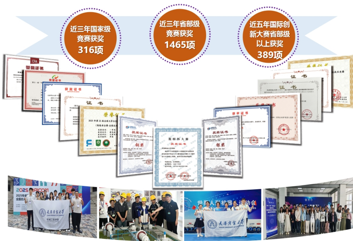
图 5 代表性竞赛获奖情况及创新实践活动

成果面向商工双向赋能育人目标，覆盖商科、工科共 40 个专业，累计培养学生 2 万余人。用人单位对毕业生总体满意度达到 100%， “很满意”比例接近六成，对毕业生“解决问题能力”“沟通与交流能力”“终身学习能力”的需求度评分均在 4.84 分以上。工科学生技术成果转化与产业场景适配维度优良率达 89.46%，商科学生数据驱动决策与技术逻辑穿透维度优良率达 84.68%。多家企业用人单位对毕业生的工作能力与综合素养给予了好评反馈。专业竞赛方面，学生近三年获国家级学科竞赛奖项 60 余项、省部级学科竞赛 200 余项，商工交叉类项目获奖占比超过 30%，体现出学生在跨学科协同、真实问题解决和成果转化应用方面的综合竞争力持续增强。