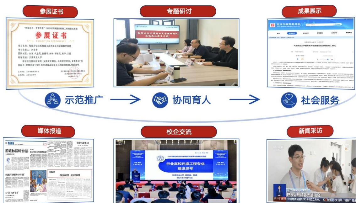
图 6 成果示范辐射与社会影响

研讨会作主旨交流，在河北工业大学、中南财经政法大学等多所高校推广应用，并与天津工业大学、哈尔滨商业大学等开展经验交流，为同类高校破解商工融通路径不清、数智赋能不深等问题提供可借鉴方案。教学改革经验多次被中央广播电视总台、《中国教育报》《光明日报》等主流媒体专题报道。服务河南省漯河市制冷智能装备产业链企业专题培训班，支持 50 余家企业提升技术人员商业思维与管理人员数智化素养，彰显了商工双向赋能人才培养模式服务区域产业转型升级的实践价值。